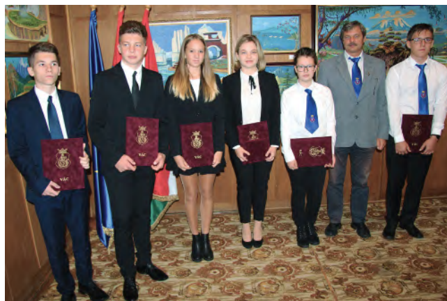
Vác Város kiváló diákjai

Iskolánkban egy komoly és összetett elismerési rendszer alakult ki az évek során. Ezen belül külön kategóriát képeznek az éppen ballagók által átvettek, hiszen az ő esetükben nem egy tanév, hanem a nálunk eltöltött idő egészét vesszük figyelembe. Külön emeli az átadás fényét, hogy ez több ezer ember előtt a ballagási ünnepségen történik.