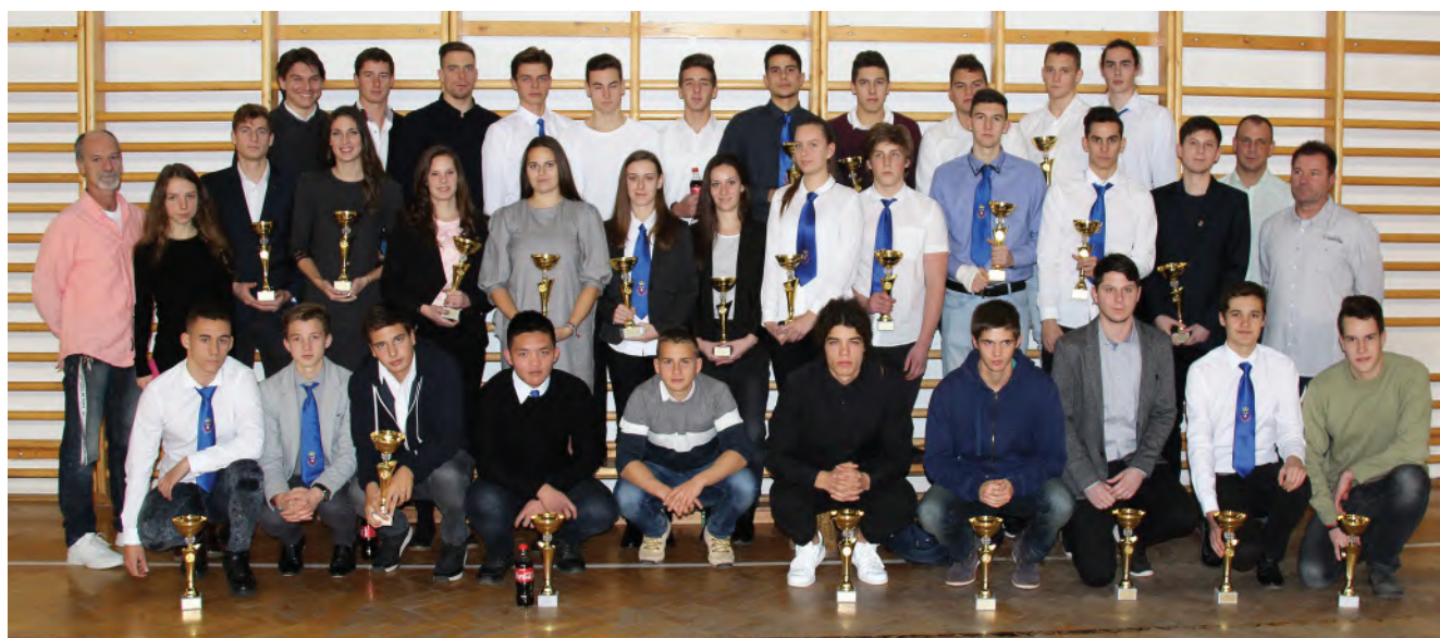
A váci diákolimpikonok ünnepe - 2017