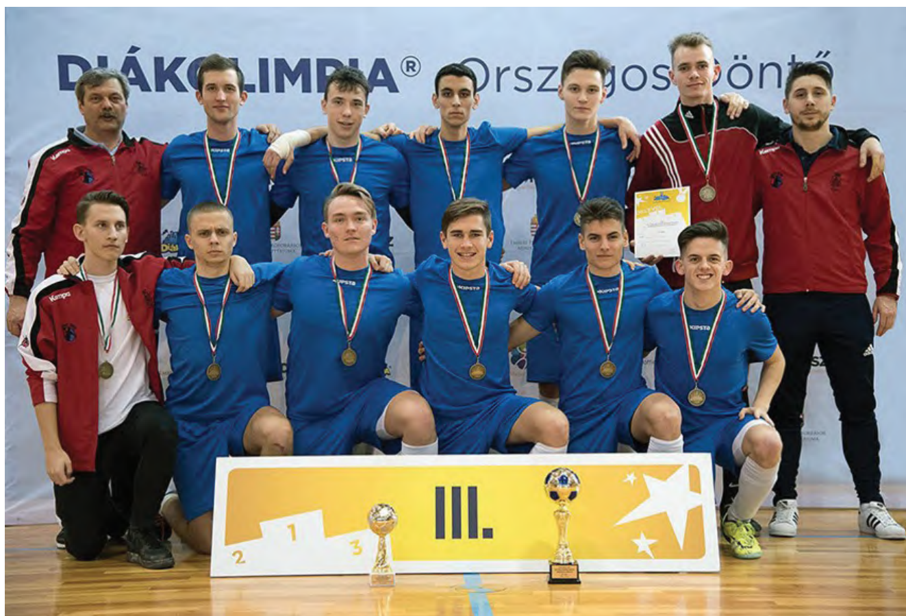
Futsal Diákolimpiai III. helyezett csapatunk