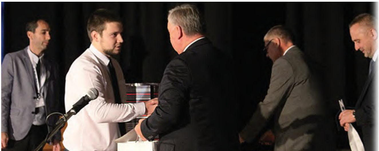
Pattantyús Nyomtatott Áramkör Tervező Verseny I. helyezés