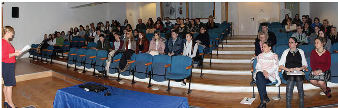
Implom József Helyesírási Verseny tájékoztatója