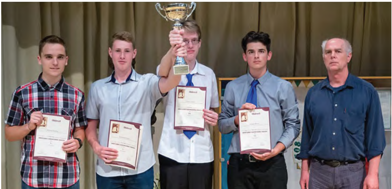
Simonyi Károly Országos Elektrotechnika verseny I. helyezés